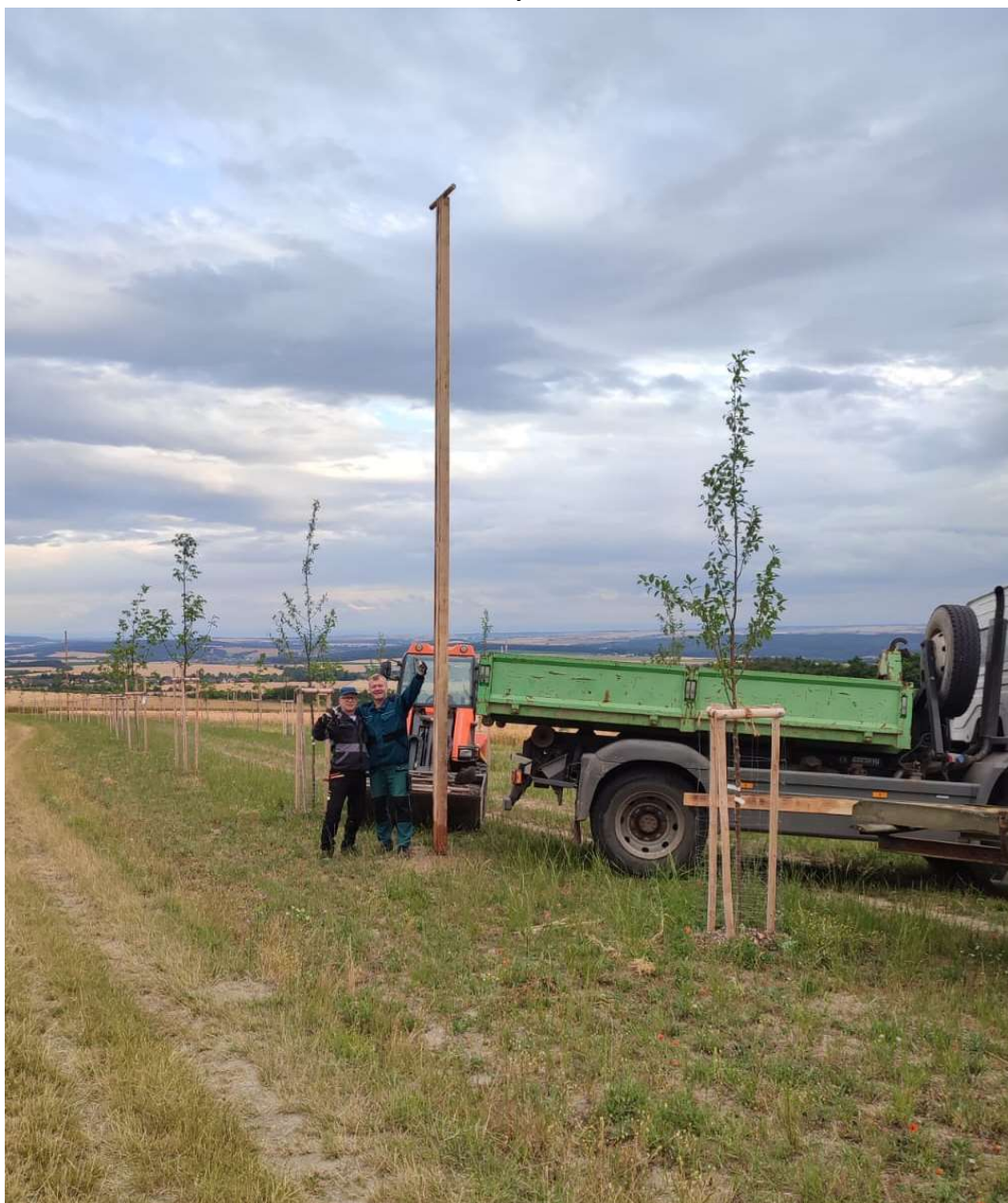
Instalace sedáků pro dravce v nové aleji