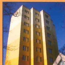
Dům s pečovatelskou službou Wintrovo nám. 1903, Rakovník