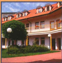
Dům s pečovatelskou službou Vysoká 91, Rakovník