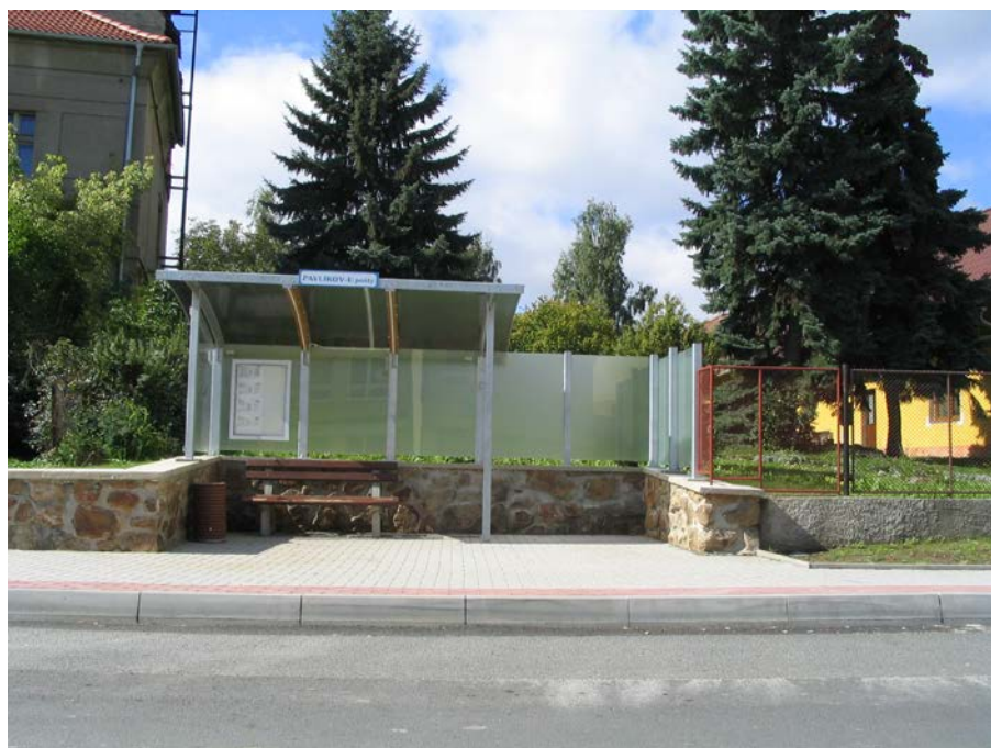
Nová autobusová čekárna „Pavlíkov U pošty“