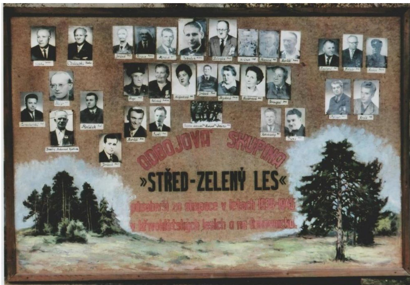
Tablo účastníků protifašistické odbojové skupiny „Zelený les“