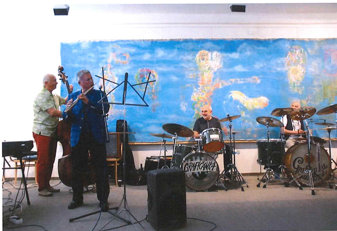
hudebníci při koncertu

Ve vestibulu Městysu Pavlíkov můžete shlédnout výstavu prací dětí z mateřské a základní školy v Pavlíkově