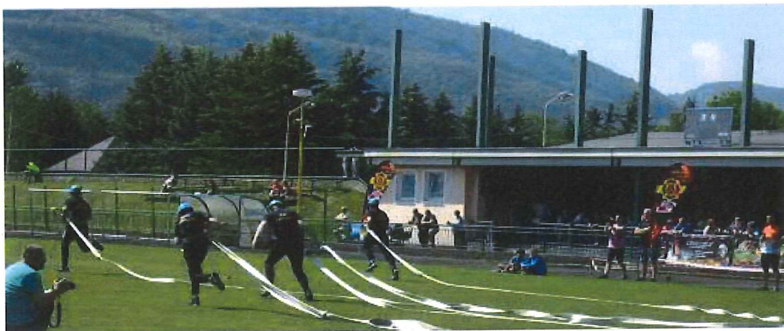
foto požární sport na Skřivani

Další nová možnost využití volného času.