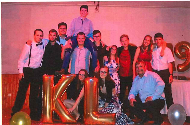
Foto z vyhlášení Krušnohorské ligy konané 2.11.2019, kde soutěžní družstvo převzalo ocenění za krásné deváté místo z devatenácti družstev v sezoně 2019.

V letošním roce se umístili v okresním kole v Panošim Újezdu a na memoriálu v Chrášťanech pokaždé na třetím místě.