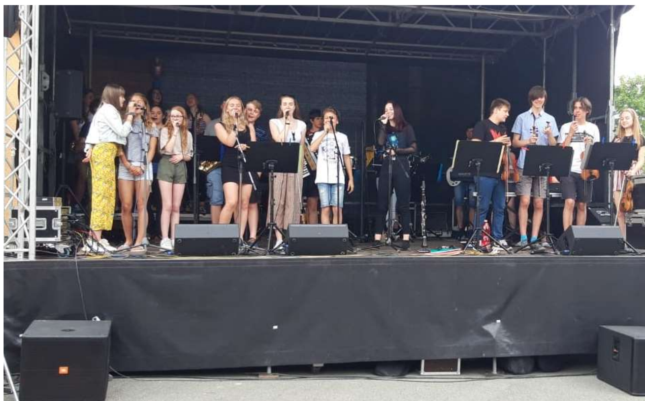
vystoupení Základní umělecké školy Rakovník