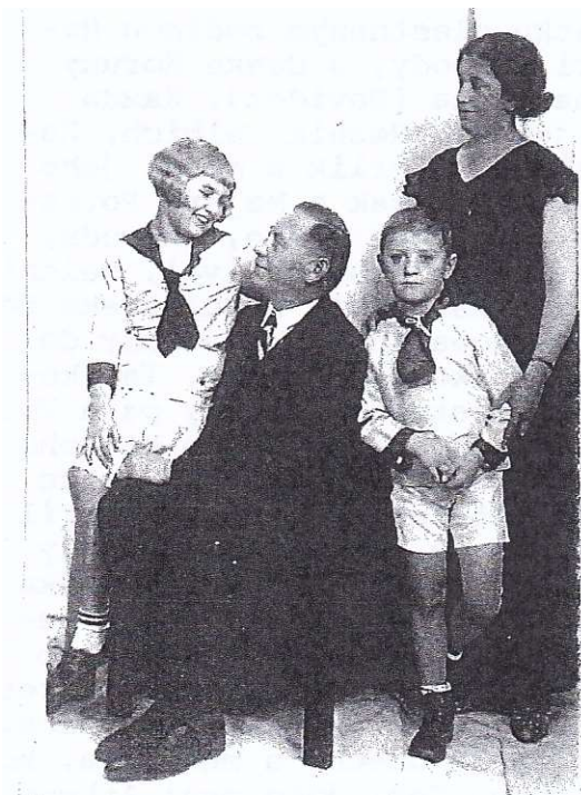
Nase rodina Na Volanove ve Vokovicich.

dopadne to tak, jako pro vysokoškoláky. Zaměstnání jsem dostal v Poštovní Technické Ústředně na Letné, která v tu dobu byla v dnešním technickém muzeu. Práce rukama mě nevadila, a tak jsem se pomalu stal opravářem telefonů. V květnu 1945 skončila válka a tím moje působení v ústředně. Ale