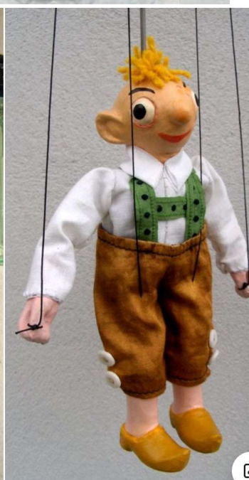
Jedno z představeních divadélka