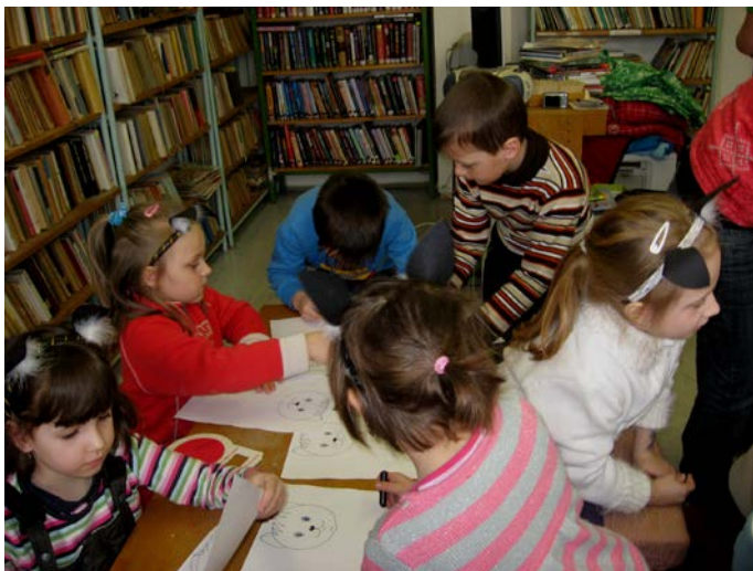
Návštěva dětí MŠ v knihovně.